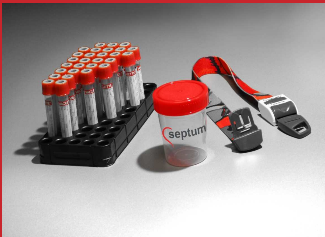
LABORATORIJSKE PREISKAVE KRVI IN URINA